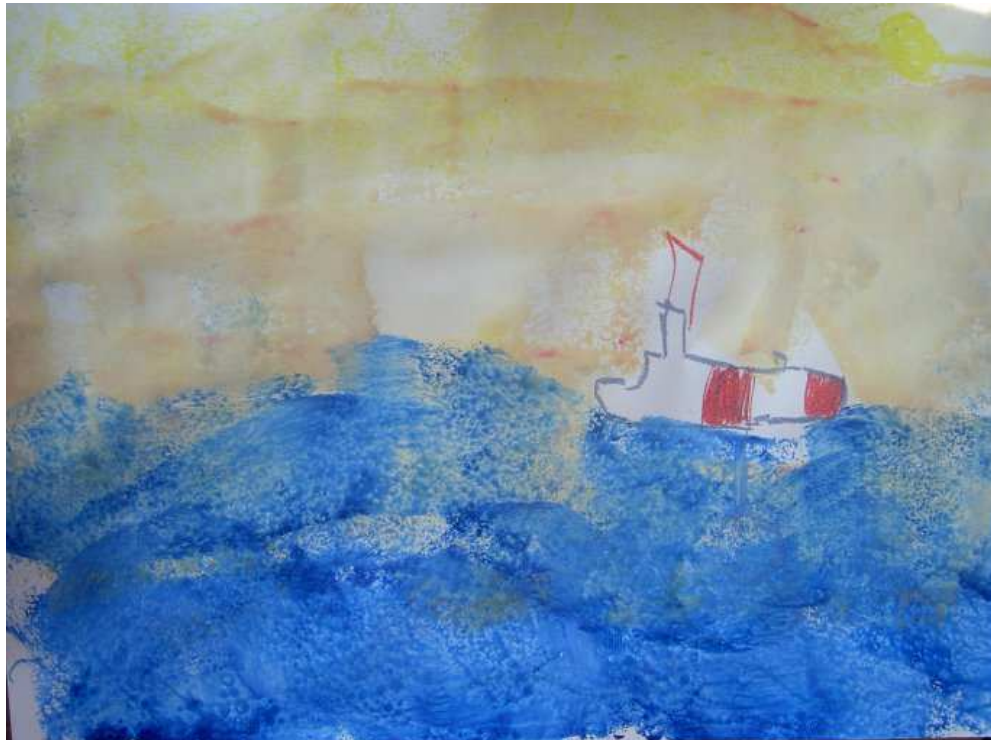
L'Hespèrides: navegant i llançant el CTD