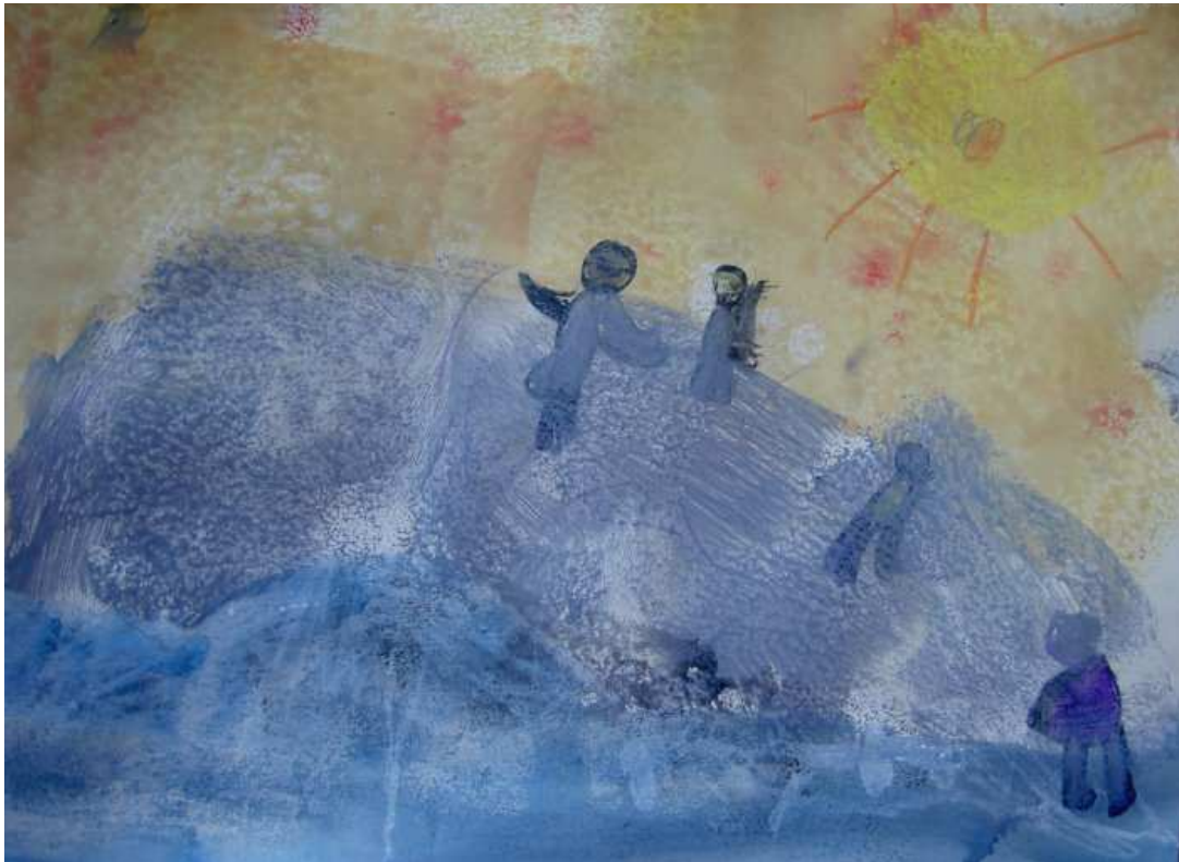
Expedicionari baixant a terra veure els pingüins.

I per acabar vos enviam alguns dibuixos o pintures que hem fet del que més ens ha agradat fins ara: