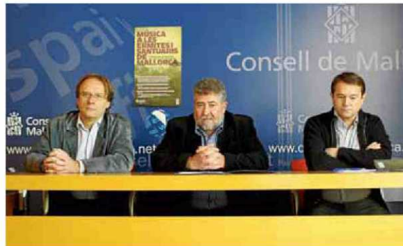
Company, Font i Garcies anuncien ahir el cicle musical.

El primer concert tindrà lloc a la sala de Gramàtica diumenge, dia