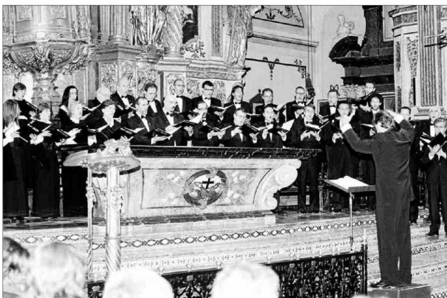
Imagen de archivo de una actuación de la Coral Universitaria de les Illes Balears.

CLÁSICA La formación coral de la Universitat lleva su música a las ermitas y santuarios de Mallorca • Los conciertos, gratuitos, arrancan este domingo, a las 12.00 horas, en el Santuari de Cura